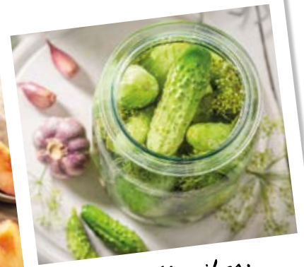
Der Klassiker: Saure Gurken