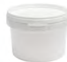
JETB rund weiß 550 ml VE1 108 | VE3 108 HV 3500