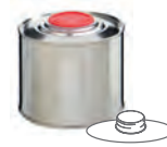
DIN42 / HZ 401 500 ml UN 1A1/X/250 99 x 90 mm KV 120 | PV 1440 IV 880