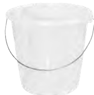
Metallbügel rund transparent 10,0 l HV 660