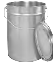
bb 12000 ml 230 / 217 x 325 mm KV 20 | PV 120 IV 330