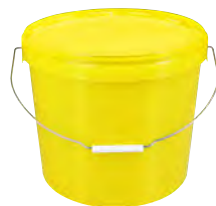
JET P rund gelb 18,0 l HV 280