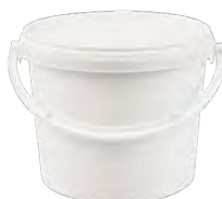
JET P rund weiß 3,0 l VE1 40 | VE2 120 VE3 40 | HV 760