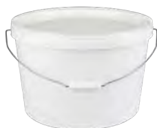
JETO P oval weiß 18,0 l VE1 40 | HV 320