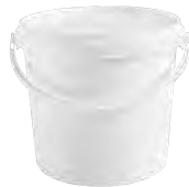
ERZ UN1H2/Y7/S/.. Kunststoffbügel weiß 5,6 l HV 684