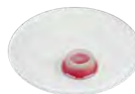
Deckel mit Ausgießer Innenansicht