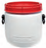
26,0 l Ø 338 mm h 358 mm