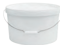
JETO P oval weiß 12,5 l HV 440