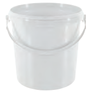
JET P rund weiß 10,7 l VE1 25 | VE2 - | VE3 25 HV 200/600