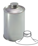
BVS 30 500 ml 80 x 110 mm KV 120 | PV 1440 IV 980