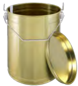
gold 2500 ml 130 x 165 mm KV 33 | PV 396 IV 480