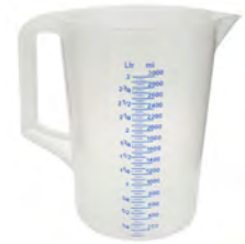
transparent 3000 ml KV 1 | PV 500