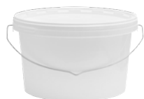
JETO P oval weiß 5,5 l VE1 30 | HV 960