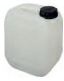
2,5 l natur DIN 45 125 g | UN-Y VE 56 | HV 300