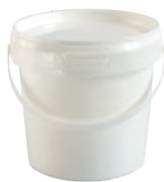
JETB rund weiß 600 ml VE1 100 | VE2 100 HV 4060