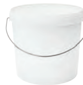
JET P rund weiß 12,5 l VE1 20 | VE3 25 HV 550