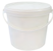
JET P rund weiß 11,0 l HV 550