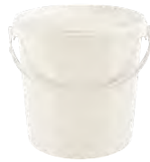
JET P rund natur 10,7 l HV 600