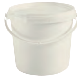
JET P rund natur 5,3 l HV 1080