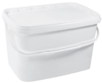
JETR P rechteckig weiß 21,0 l HV 304