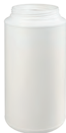
2000 ml 1H2/X3,8/S/A/PA-01 KV 45 | IV 462