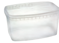
#907 glasklar 2575 ml HV 1131