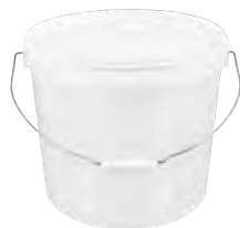
JET2+ rund weiß 18,0 l HV 240