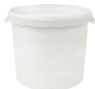
JET P rund weiß 26,0 l HV 204