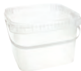
JET Q quadratisch transparent 3,5 l HV 1920