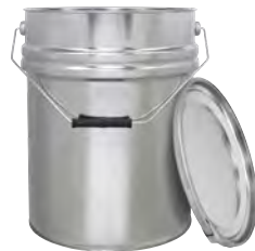
bb 20000 ml UN 280 / 262 x 376 mm KV 6 | PV 36 IV 147