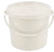
JET P rund natur 5,6 l VE1 - | VE2 - | VE3 36 HV 1080