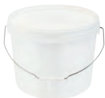
JET2+ rund weiß 16,0 l HV 320