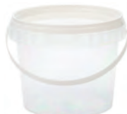
JET rund transparent 2,3 l HV 1200