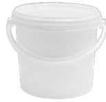
JET P rund weiß 3,8 l HV 760