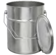
bb 5000 ml UN/1A2/Y100/ 185 / 175 x 227 mm KV 36 | PV 216 IV 264