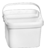
JET Q quadratisch weiß 3,5 l VE1 100 | HV 1920