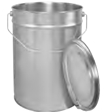
bb 12000 ml UN/1A2 Y1.3/120/ 230 / 217 x 325 mm KV 20 | PV 120 IV 270