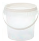
JETB rund transparent 365 ml HV auf Anfrage