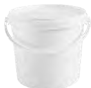
JET rund weiß 2,6 l VE1 40 | VE2 120 VE3 120 | HV 1200