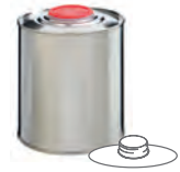
DIN42 / HZ 401 750 ml UN 1A1/Y/200 99 x 119 mm IV 704