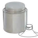
BVS 80 500 ml 99 x 80 mm KV 125 | PV 750 IV 880