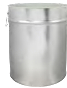
is 30000 ml UN 328 / 312 x 410 mm IV 96