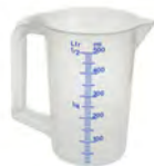
transparent 500 ml KV 1 | PV 496