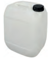
10 l natur DIN 51 400 g | UN-Y VE 20 | HV 140