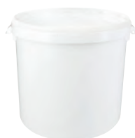
JET P rund weiß 30,0 l VE1 12 | VE3 12 HV 180