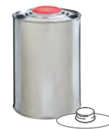
DIN42/HZ 401 1000 ml UN 1A1/X/250 99 x 149 mm KV 80 | PV 960 IV 528