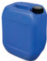
10 l blau DIN 51 400 g | UN-Y VE 20 | HV 140