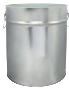
is 30000 ml UN 328 / 312 x 390 mm IV 112