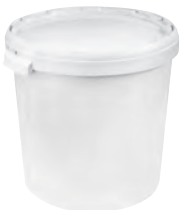
HRK UN1H2/Y32Z40/S/.. Hobbock weiß 30,0 l HV 150