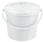
JET P rund weiß 3,5 l VE1 40 | HV 1350