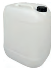
25 l natur DIN 61 1070 g | UN-X VE 12 | HV 60