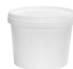
JETB rund weiß 1560 ml VE1 100 | VE3 100 HV 2000