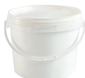
JET rund weiß 2,3 l VE1 40 | VE2 120 VE3 40 | HV 1200