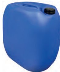
30 l blau DIN 61 1300 g | UN-X VE 8 | HV 48