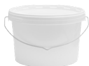
JETO P oval weiß 3,5 l VE1 50 | HV 1400