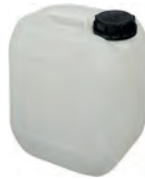
5 l natur DIN 51 280 g | UN-X VE 28 | HV 252