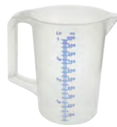
transparent 1000 ml KV 1 | PV 504