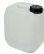
5 l natur DIN 51 230 g | UN-Y VE 28 | HV 252