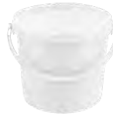
JET P rund weiß 5,6 l VE1 36 | VE2 72 VE3 36 | HV 1080