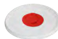
Deckel mit Feuchttuchspender