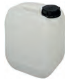
3 l natur DIN 51 130 g | UN-X VE - | HV 280