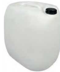
30 l natur DIN 61 1300 g | UN-X VE 8 | HV 48