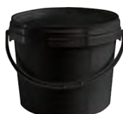
JET rund schwarz 2,3 l VE1 40 | HV 1200