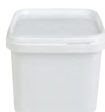
JETS eckig weiß 1000 ml VE1 240 | HV 3240