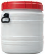
55,0 l Ø 410 mm h 495 mm