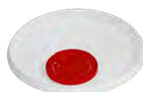
Deckel mit Siegeldeckel Außenansicht