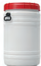
75,0 l Ø 410 mm h 680 mm