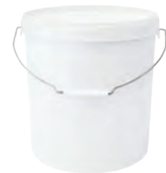
JET P rund weiß 15,0 l VE1 17 | VE3 17 HV 550