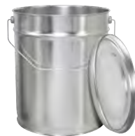
bb 10000 ml UN/1A2/Y/100/ 230 / 217 x 281 mm KV 20 | IV 330