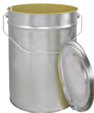
innen doppelt schutzlackiert 12000 ml UN/1A2/Y/100/ 230 / 217 x 325 mm KV 1 | IV 246