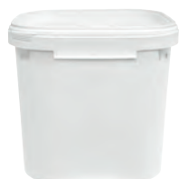
JET Q quadratisch weiß 35,0 l HV 144