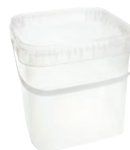
JET Q quadratisch transparent 5,0 l HV 1920