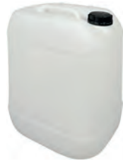
20 l natur DIN 61 900 g | UN-X VE 12 | HV 72