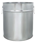
bb 25000 ml UN 328 / 312 x 370 mm IV 96 | KV 6