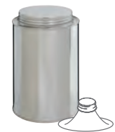
BVS 80 1000 ml 99 x 149 mm KV 72 | PV 846 IV 528