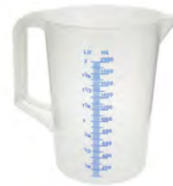
transparent 2000 ml KV 1 | PV 504