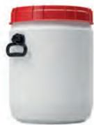
34,0 l Ø 338 mm h 449 mm