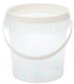
#5122 glasklar 600 ml Ø 110 mm VE1 - | VE2 - | VE3 504 HV 4032