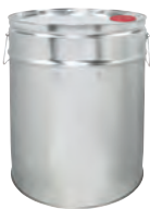
DIN 57 / HZ 601 30000 ml UN 1A1/Y/120/ 328 / 312 x 425 mm IV 28