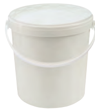
JET P rund weiß 21,0 l VE1 15 | VE3 15 HV 320