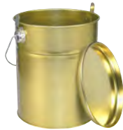
gold 5000 ml 160 x 205 mm KV 18 | PV 216 IV 165