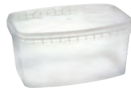
#905 glasklar 1750 ml VE1 150 | HV 1682