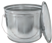
bb 6000 ml UN/1A2/Y100/ 230 / 217 x 175 mm KV 36 | PV 216 IV 165