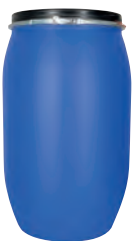
220 l blau Ø 587 mm 8,0 kg | h 967 mm UN 1H2/X404/S