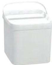
JET Q quadratisch weiß 5,0 l VE1 80 | HV 1920