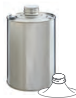
BVS 30 1000 ml UN 1A1/X/250 99 x 149 mm KV 60 | PV 720 IV 440