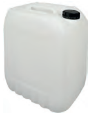
20 l natur DIN 61 730 g | UN-Y VE 12 | HV 72