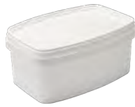
#908 weiß 1235 ml VE1 59 | HV 1711