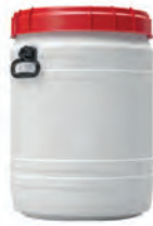
64,0 l Ø 410 mm h 573 mm