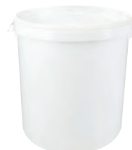
JET P rund weiß 32,0 l VE1 10 | HV 216