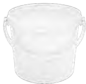
JET P rund transparent 5,6 l HV 1080