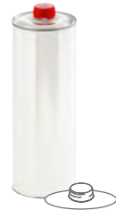
DIN42/HZ 401 1000 ml UN 80 x 225 mm