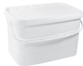
JETR P rechteckig weiß 12,5 l HV 420