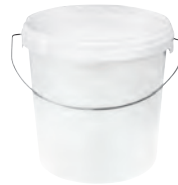
ERZ UN1H2/Y12,3/S/.. Metallbügel weiß 10,2 l HV 300