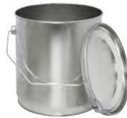
bb 3000 ml 163 / 156 x 180 mm UN* KV 27 | PV 162 IV 297