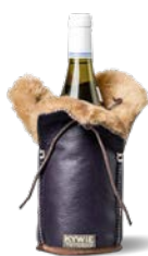
C23SL Aubergine silk