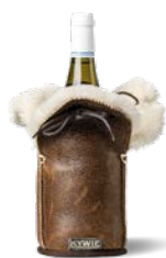
C04KL Brown leather