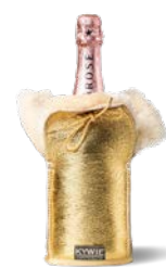
C1500 Gold Sparkle