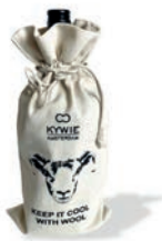
Canvas Gift bag