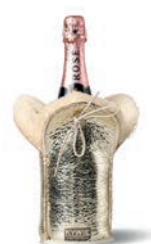
C1600 Silver Sparkle