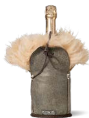
C06KL Brown Fluffy