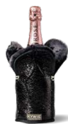
C1000 Black Sparke